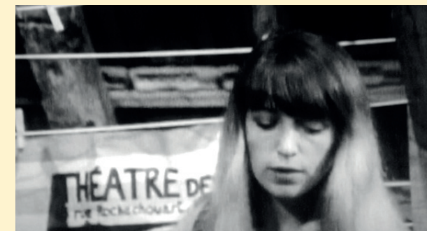
Das ist nur der Anfang, der Kampf geht weiter. Filmausschnitt.

APRIL / DOKUMENTARFILM UND ANSCHLIESENDES GESPRÄCH MIT DER REGISSEURIN CLAUDIA VON ALEMANN