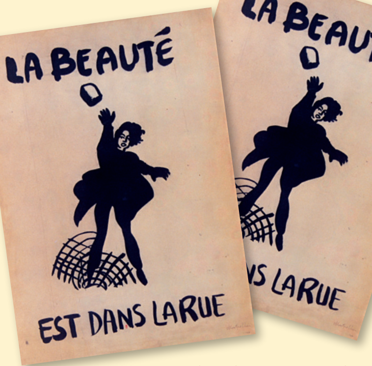
„Die Schönheit ist auf der Straße“ · Montpellier · 1968 · Bnf